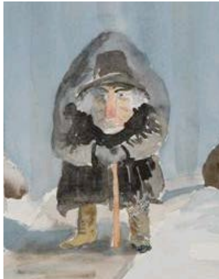
Kvällsveckan Akvarell av Sven-åke Modin 2008