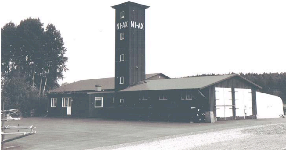
NI-AX Hallar i gamla brandstationen, Hällekil