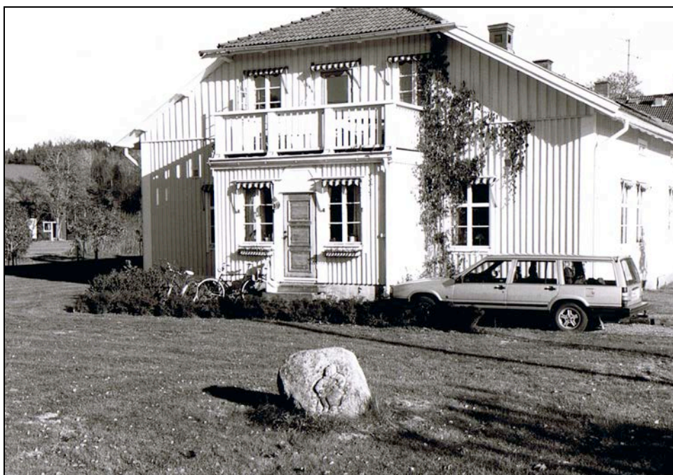
Minnesstenen vid Hällekils vårdhem

snickeri, sygård, träningslokal samt förråd. Uthusbyggnaden söder om mangårdsbyggnaden innehåller numera kontor och musikrum. Övervåningen användes som förråd.