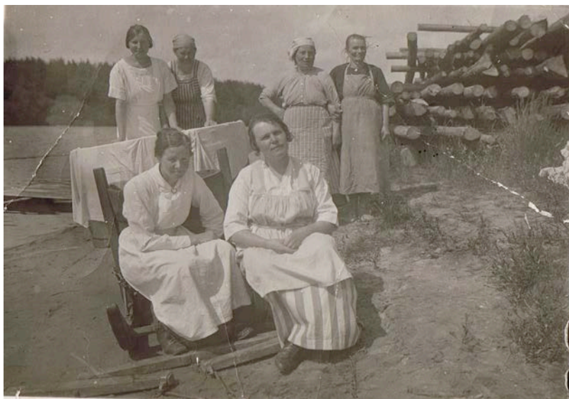
Vårdhemmets tvätt sköttes vid Klarälven