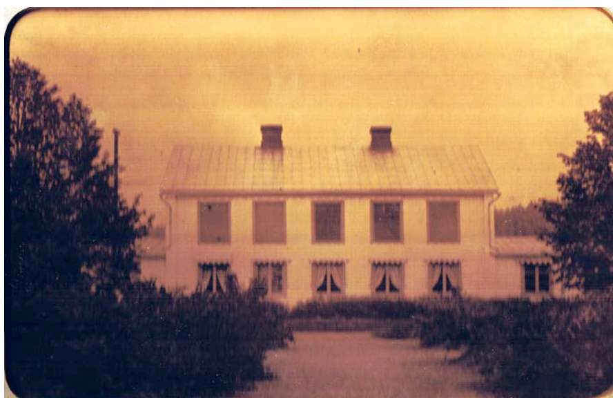
Hällekils vårdhem år 1906, västra frontsidan