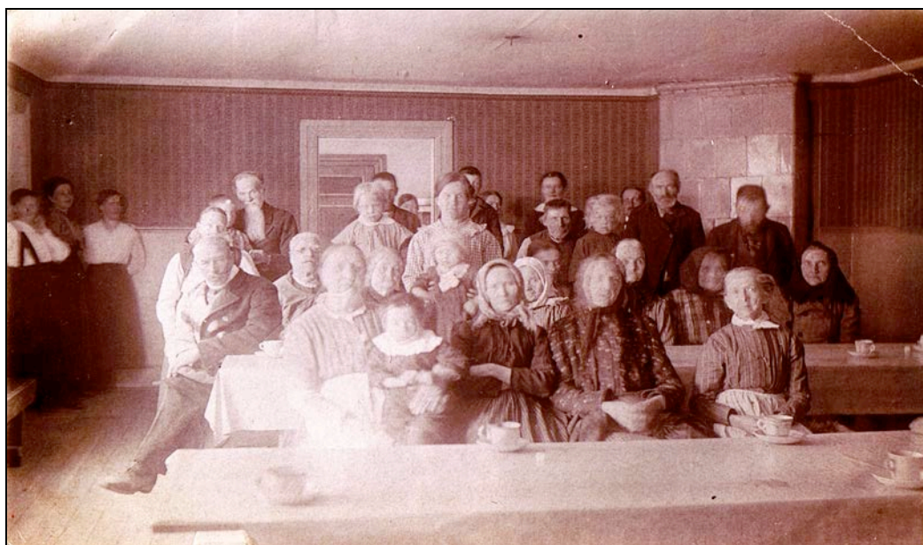
Fattiga, gamla och personal på ålderdomshemmet i Hällekil (omkring 1914)

Det var efter den tidens förhållanden stora pengar och mera behövdes ty husen kunde inte omedelbart tas i bruk till ålderdomshem. Det gällde att bygga en särskild avdelning med rum för hemmets pensionärer. Åren omkring sekelskiftet hölls den ena sockenstämman efter den andra och alltid rörde det sig om nya utgifter för att få fattigvårdsfrågan ordnad. Många betänksamma röster höjdes emot de stora kostnader som krävdes. Många sockenbor talade om att denna ordning fortsätter, så skulle till sist resultatet bli att flertalet av socknens bönder själva skulle hamna på Hällekils fattiggård.