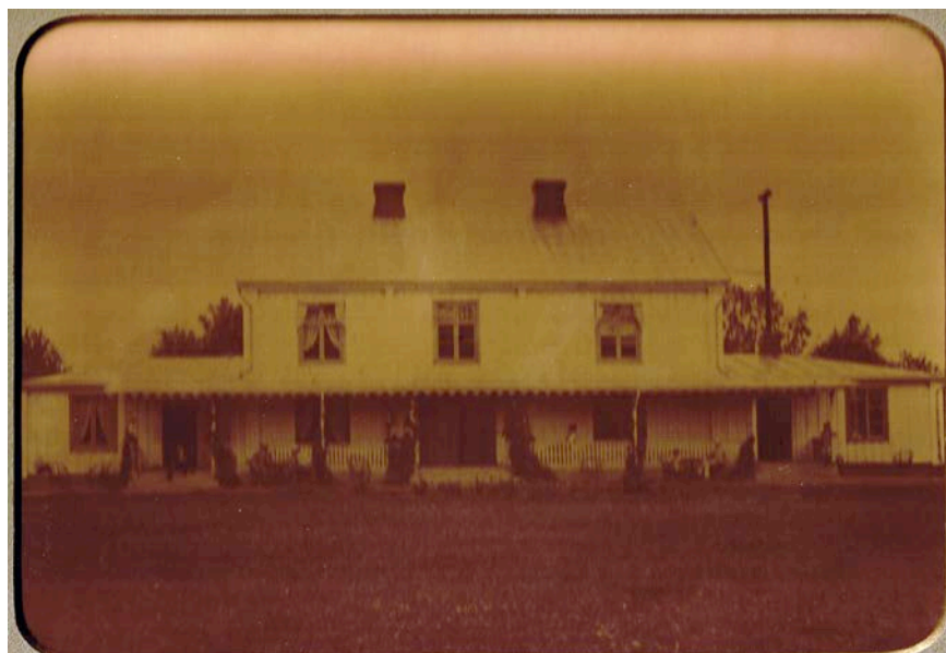
Hällekils vårdhem år 1906, östra frontsidan