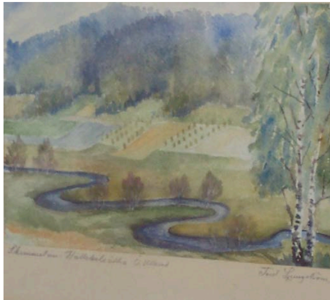
Skimmelån vid Hällekilssättra akvarell av Tord Ljungström.